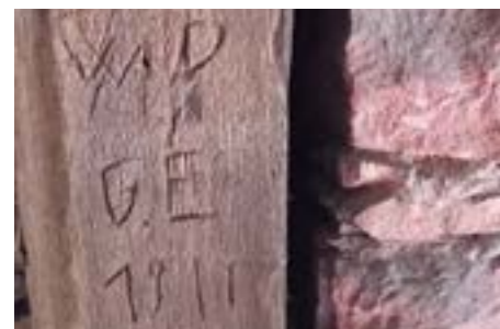
Peter Merkert Bericht und Fotos

Denen tut heute bestimmt kein Zahn mehr weh.